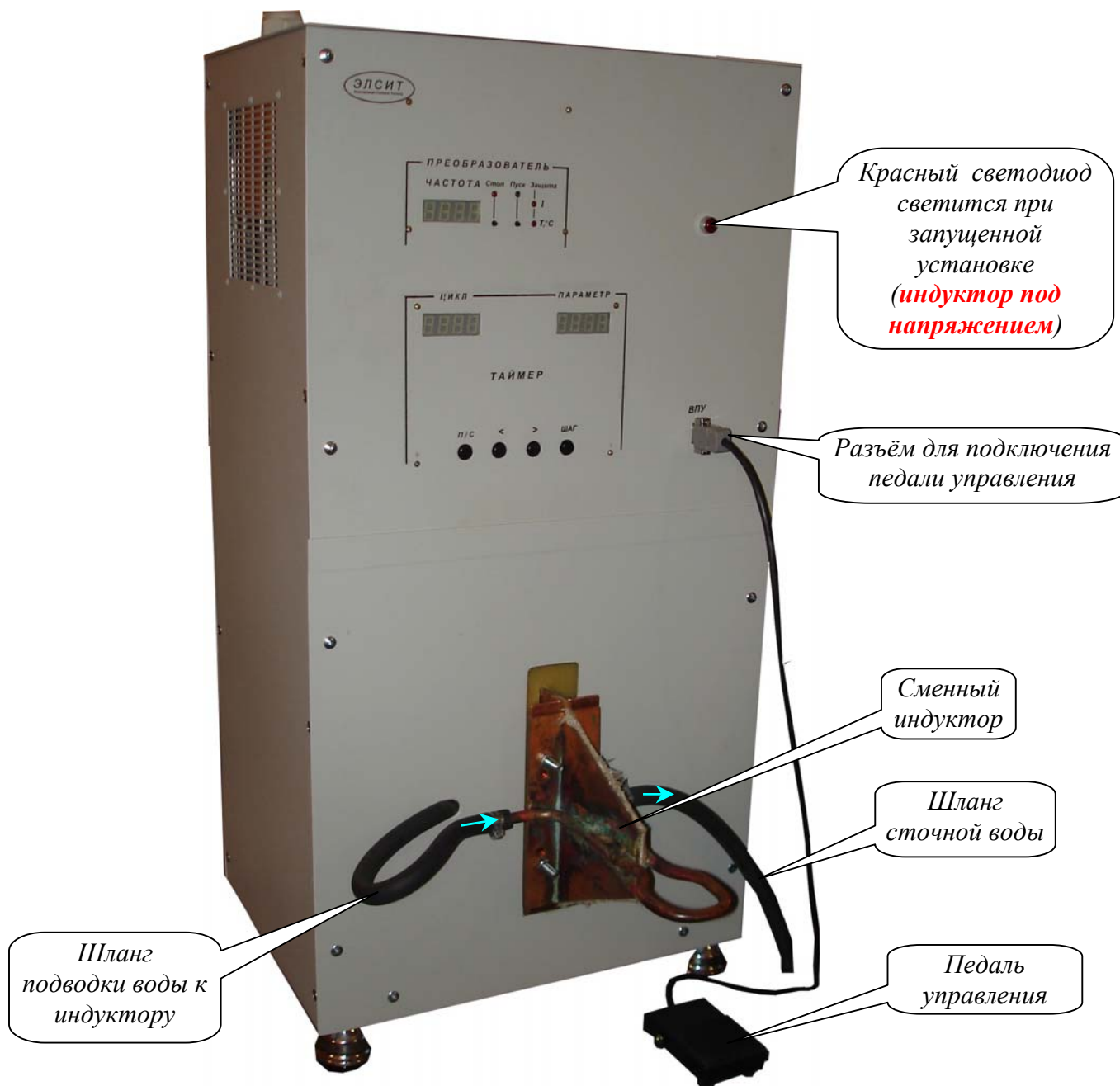
Рисунок 1. Силовой блок преобразователя (лицевая панель)