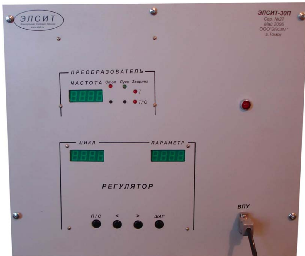
Рисунок 3. Передняя панель блока преобразователя.

На передней панели СБП (рис.3) изображены органы управления и индикации работы установки.