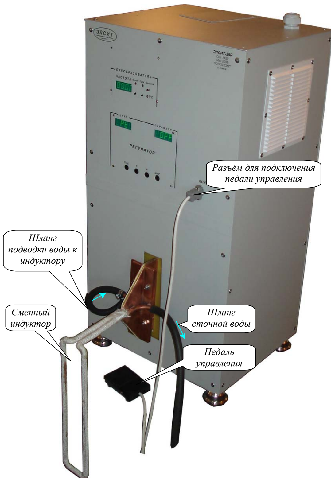
Рисунок 1. Силовой блок преобразователя (лицевая панель)