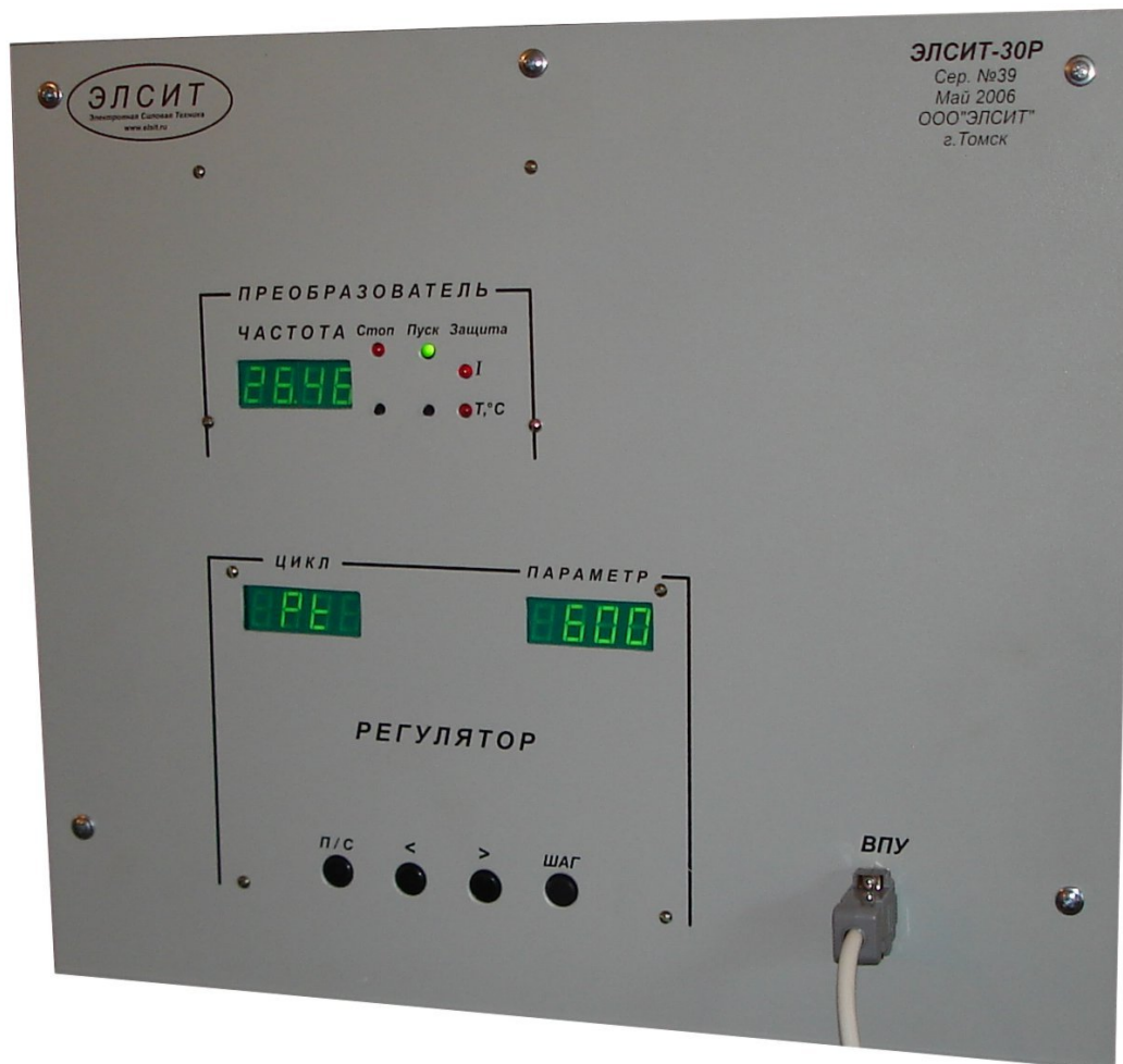
Рисунок 3. Передняя панель блока преобразователя.

На передней панели СБП (рис.3) изображены органы управления и индикации работы установки.