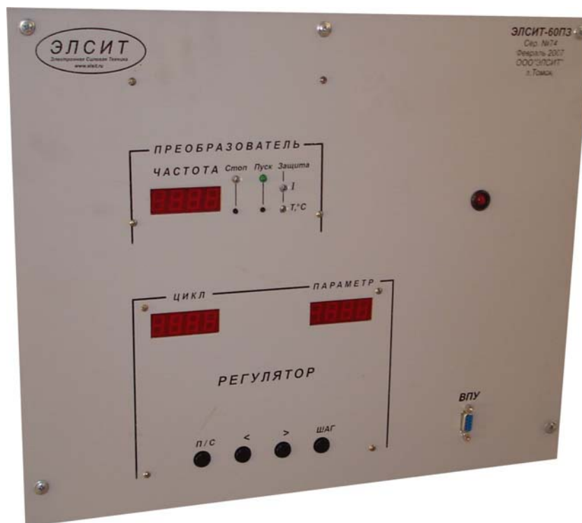
Рисунок 3. Передняя панель блока преобразователя.

На передней панели СБП (рис.3) изображены органы управления и индикации работы установки.