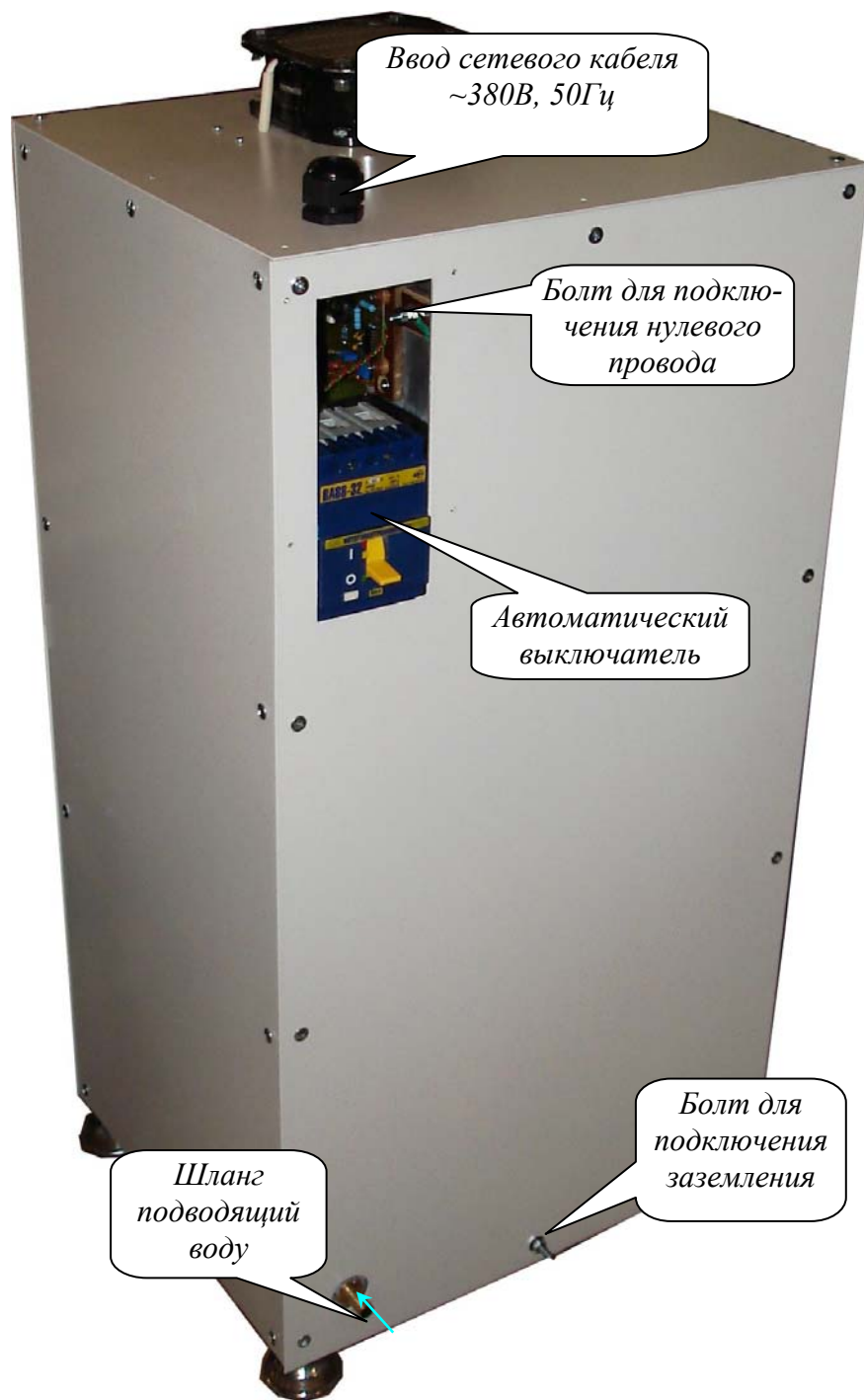
Рисунок 2. Силовой блок преобразователя (задняя панель)

Подключение сменного индуктора и педали управления изображены на рис.1. Подводка воды и подключение силового кабеля изображены на рис.2.