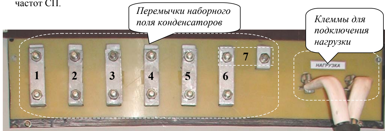
Рисунок 1. Наборное поле конденсаторов.

Подбор компенсирующей ёмкости необходим для обеспечения рабочего диапазона частот СП.