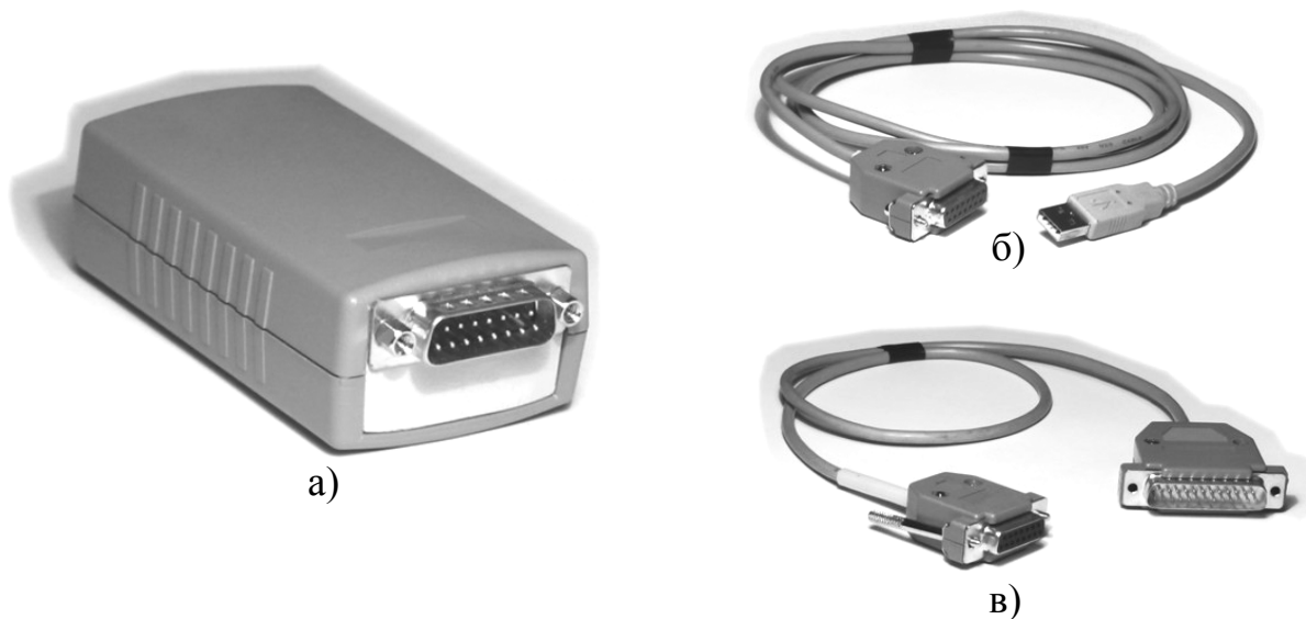
Рисунок 2. Внешнее запоминающее устройство (Блок Памяти).

Управление СП разделяется на два устройства: